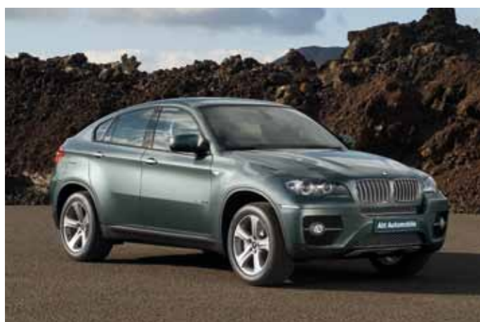
X6: der Kompromissloseste.

Von X1 bis X6, von 143 bis 555 PS, von klein und agil bis mächtig und spitzensportlich – in der BMW X-Familie findet jeder seinen Liebling. Der Begehrteste ist wohl der X1, mit seiner sportlich-eleganten Silhouette und einem Höchstmass an Agilität und Wendigkeit. Der Erfolgreichste mag der X3 sein, mit grosszügigem Platzangebot und einer bestechenden Kombination aus Komfort und typischer BMW-3er-Fahrfreude. Überraschend ist sein Bruder, der X5, mit edlem Ambiente, vereint mit dem Komfort einer grossen Limousine und beispielhaft niedrigem Treibstoffverbrauch. Und dann gibts auch noch den X6. Den kann man eigentlich gar nicht beschreiben. Kompromisslos sportlich und kraftvoll, ein Sports Activity Vehicle mit bestechenden Coupélinien.