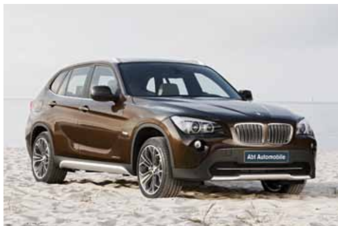
X1: der Begehrteste.