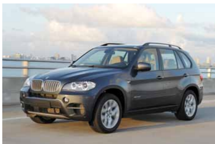
X5: der Überraschendste.

Doch einiges ist bei allen gleich – unglaublich niedrige Verbrauchswerte, das Neuste an BMW-Technologie und vor allem eines: einfach ganz viel Freude am Fahren.