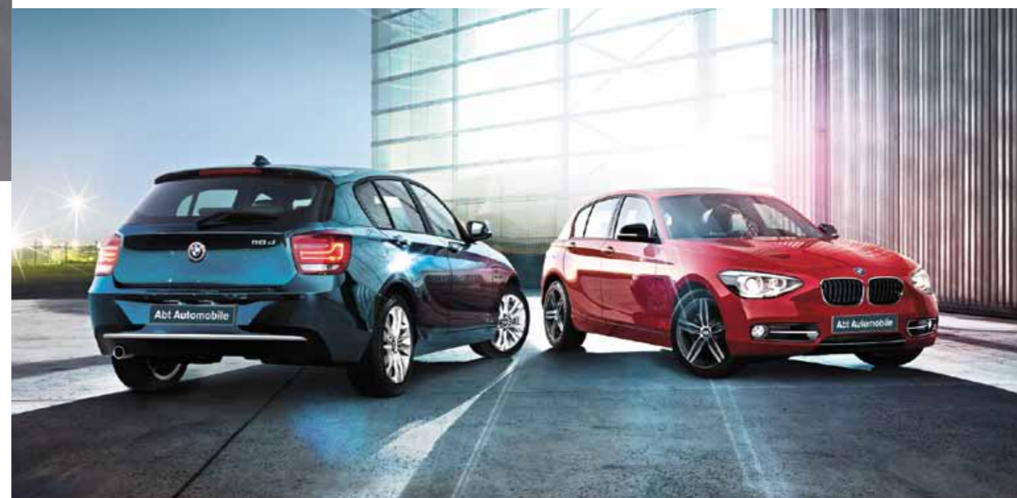
Pure Fahrfreude: die BMW Urban und Sport Line.