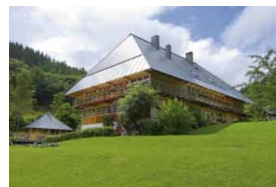
Der Gasthof Sommerau.