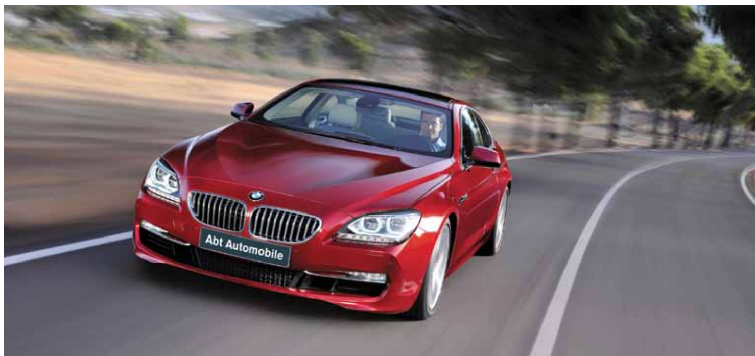
Ausdruck purer Dynamik: das 6er Coupé.

reiner Schönheit gezeichnet. Und diese Form mit pulsierender Kraft und kompromissloser Dynamik gefüllt. Das Resultat: ein Auto, das Fahrkomfort, Sportlichkeit und Schönheit in absoluter Vollendung vereint. Freuen Sie sich auf das 6er Coupé. Und testen Sie es. Weil man sich dieses Gesamtkunstwerk gar nicht vorstellen kann: Man muss es erlebt haben.